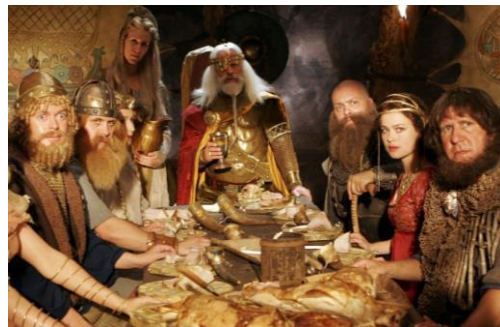
Billedet stammer fra Jul i Valhal fra 2005